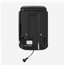
Base de carregamento