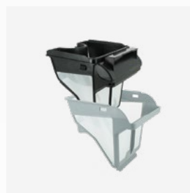
Filtro rígido Filtro de nível duplo: 150/60 µ